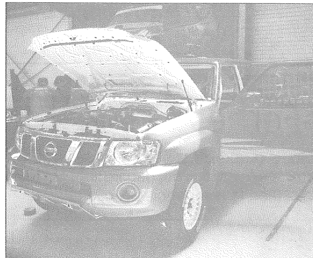
Le team Dessoude possède des clients en Chine, au Chili, aux Emirats Arabes Unis, au Turkménistan, etc.