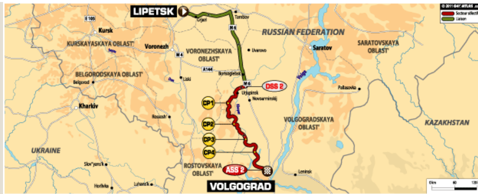
ETAPE 2 : LIPETSK - VOLGOGRAD